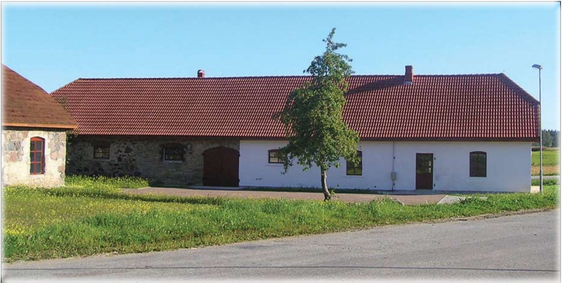
Jahimeeste seltsi muretsetud keraamikaahi hakkab asuma Maidla noortekeskuses, mis peaks ukseid avama selle aasta lõpus.

Lisaks kolme plaadiga keraamikaahjule, kus saab savist nõusid põletada, saab noortekeskus Virumaa Koostöökogu toel endale potikedra ehk savi treipingi,